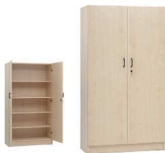
Art.488AT-H.180 ARMADIO DUE ANTE