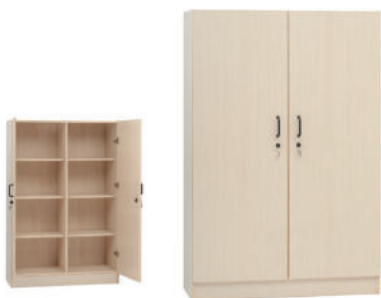
Art.488AS-H.180 ARMADIO DUE ANTE CON SOPRALZO